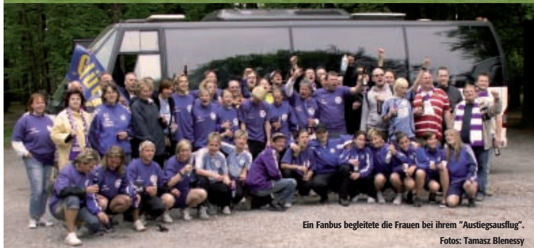
Ein Fanbus begleitete die Frauen bei ihrem "Austiegsausflug".