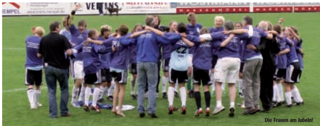
Die Frauen am Jubeln!