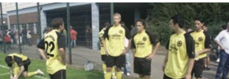
Warten auf den Schiedsrichter